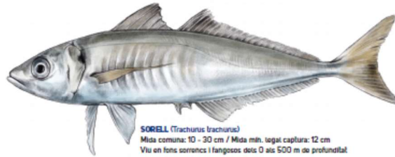
SORELL ( Trachurus trachurus ) Mida comuna: 10 - 30 cm / Mida mín. legal captura: 12 cm Viu en fons sorrencs i fangosos des 0 als 500 m de profunditat [T][R][A][C][H][U][R][U][S][T][R][A][C][H][U][R][U][S]