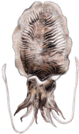
SÉPIA ( Sepia officinalis ) Mida comuna: 15 - 25 cm (mantell) / Mida mín. legal captura: sense Viu en fons sorrencs i fangosos entre 0 - 200 m de profunditat Pesca sostenible: Pla de gestió de la sépia de les badies de Roses i País [S][E][P][I][A][O][F][I][C][I][N][A][L][I][S]