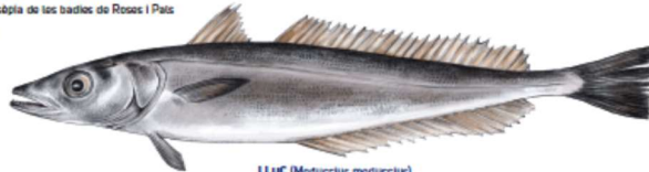
LLUÇ ( Merluccius merluccius ) Mida comuna: 20 - 60 cm / Mida mín. legal captura: 20 cm Viu sobre fons fangosos entre 25 i 370 m de fondària Pesca sostenible: Veda permanent al calader El Sagon (seif de Roses) [M][E][R][L][U][C][C][I][U][S][M][E][R][L][U][C][C][I][U][S]