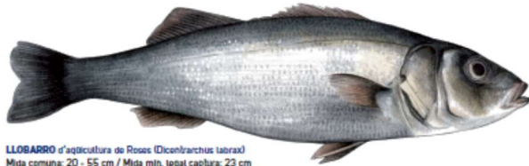
LLOBARRO d'aqüicultura de Roses ( Dicentrarchus labrax ) Mida comuna: 20 - 55 cm / Mida mín. legal captura: 23 cm En estat salvatge viu sobre fons rocosos i sorrencs entre els 0 i 100 m [D][I][C][E][N][T][R][A][R][C][H][U][S][L][A][B][R][A][X]